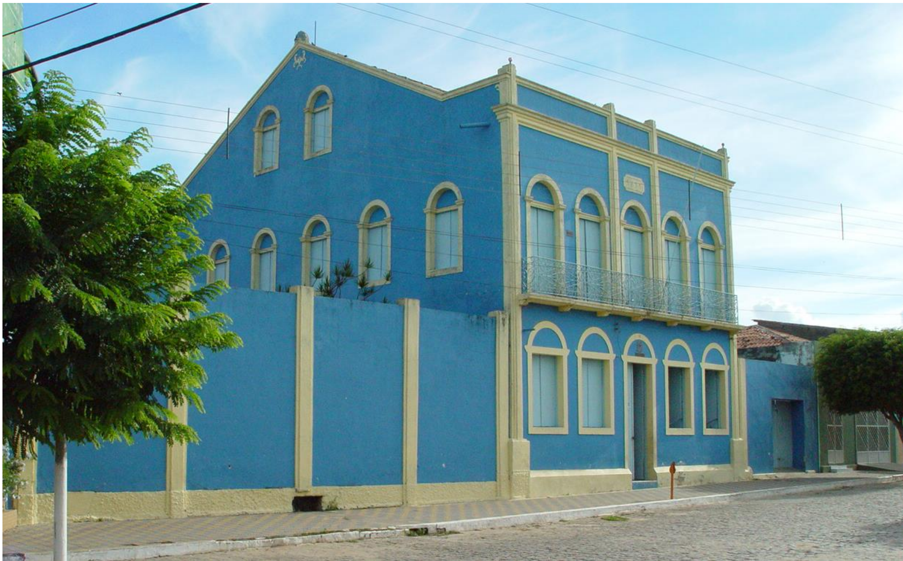
Edifício Pax - Martins