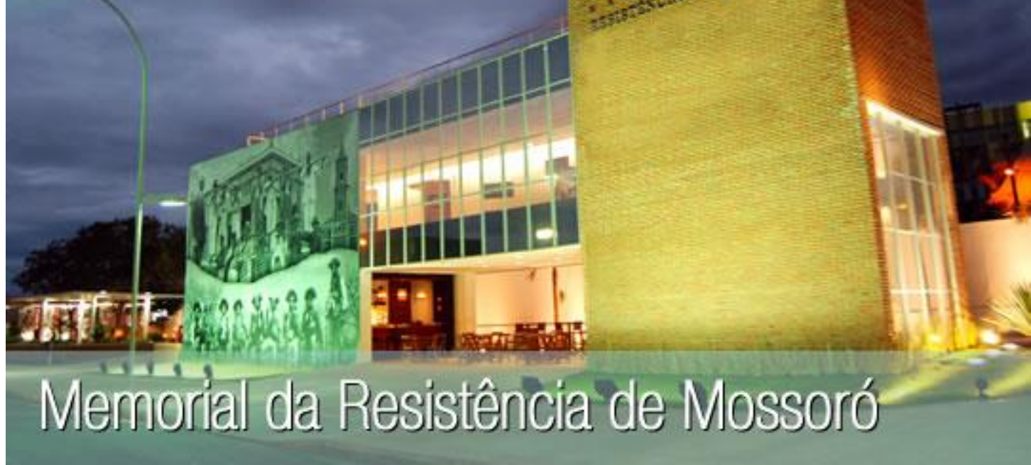
Memorial da Resistência de Mossoró