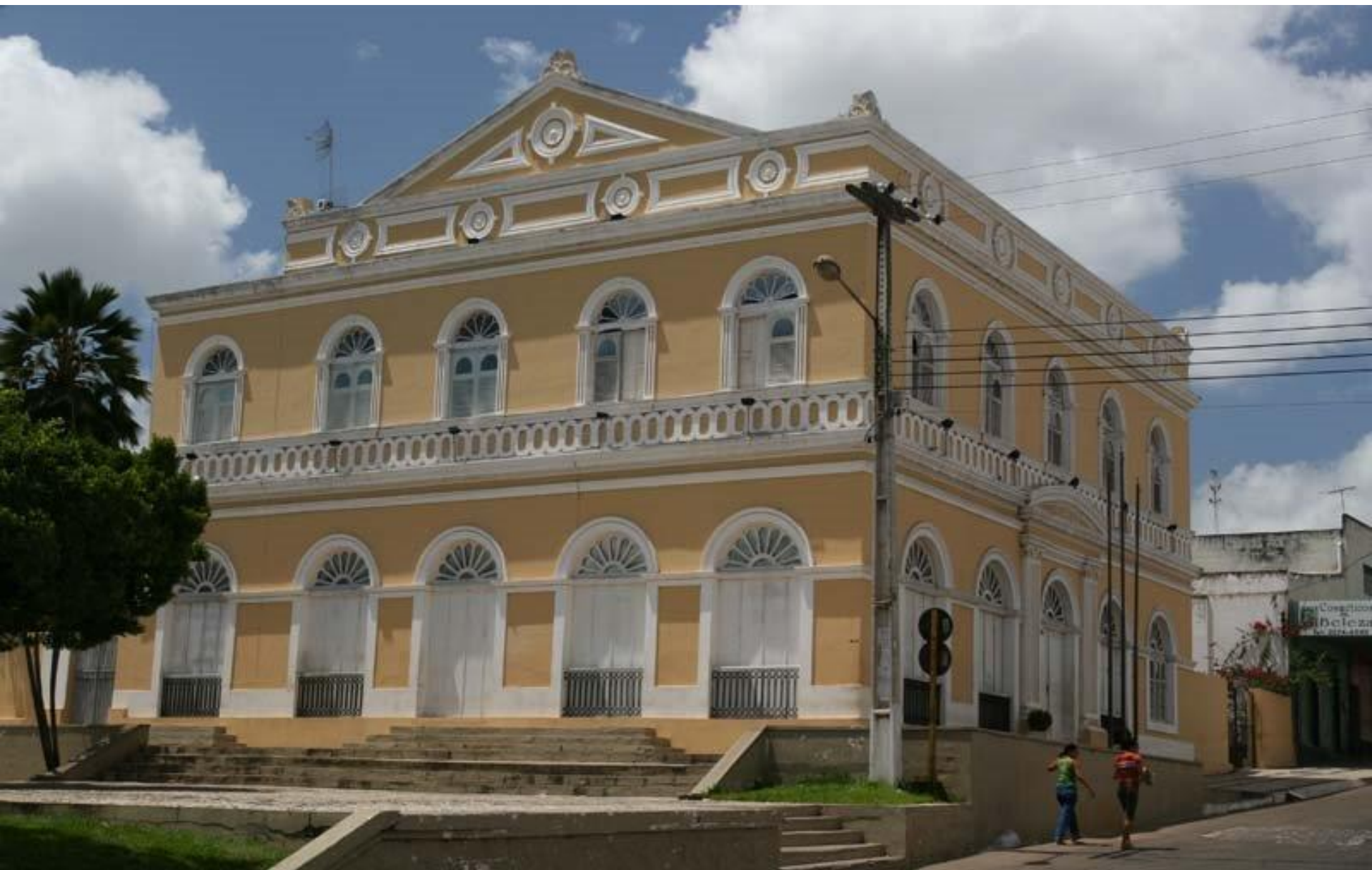
Solar Antunes - Ceará-Mirim