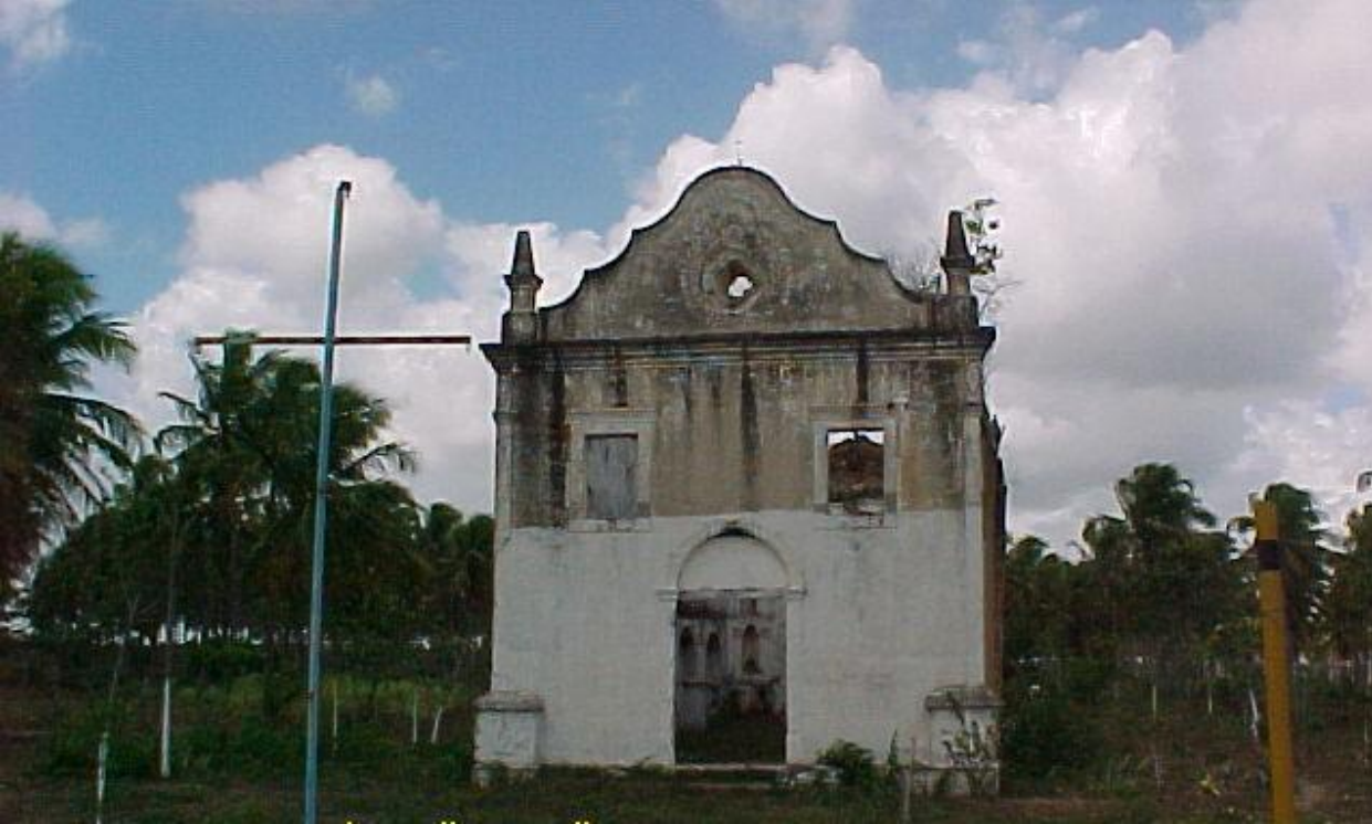
Capela de Santa Rita – Pedro Velho