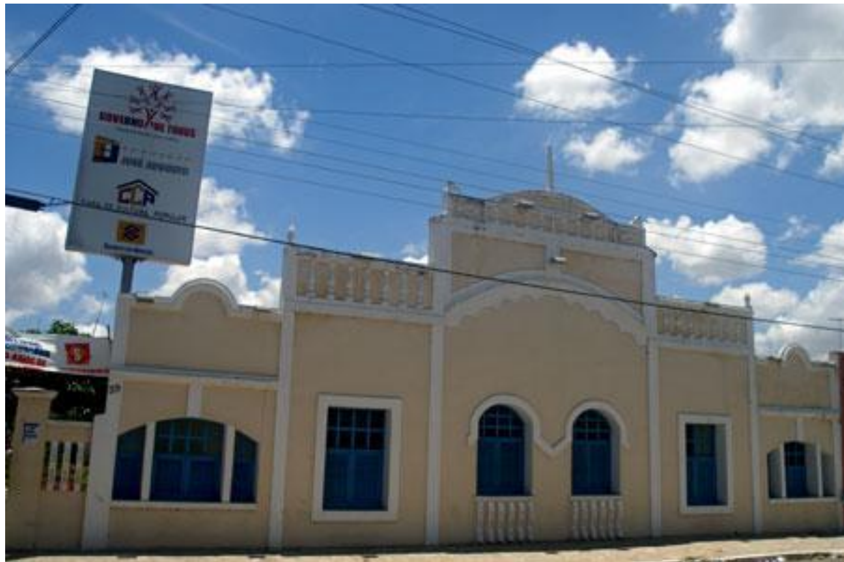
Casa de Cultura de Macaíba