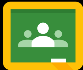
Google Sala de Aula