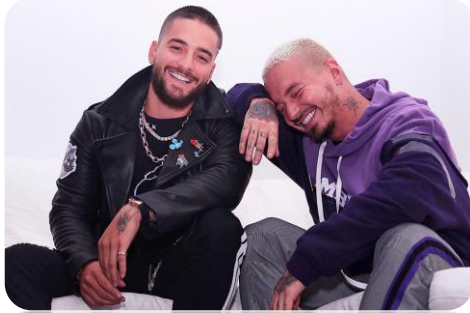
MALUMA E J. BALVIN