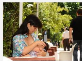
Imagem utilizada nas aulas.