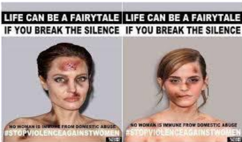
Imagem utilizada nas aulas.