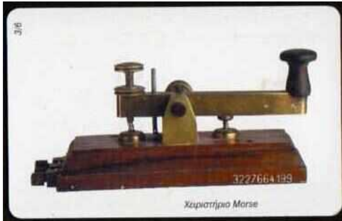
Figura 1 – Telégrafo