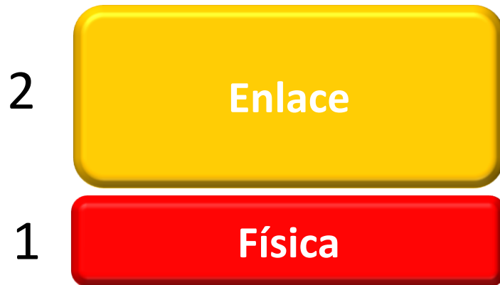
Modelo de Referência OSI

LLC – Controle do Link Lógico MAC – Controle de Acesso ao Meio