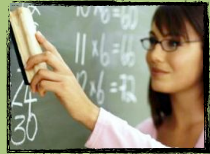
Mulheres por J. Buescu