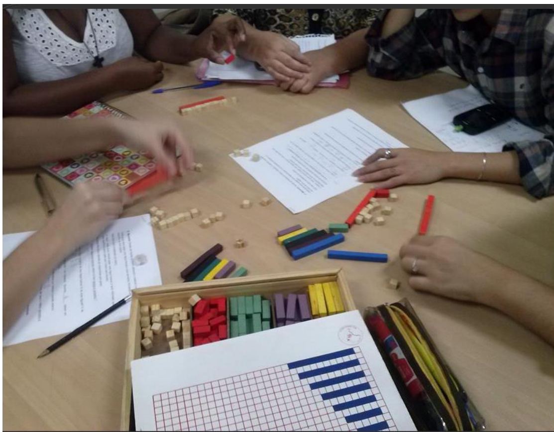
Foto 4: Estudantes utilizam as Régua de Cuisenaire voltada para frações.

Uma aluna (Aluna 4) perguntou sobre as diferenças entre os valores assumidos pelas peças do material dourado e das régua de Cuisenaire. Ela ponderou que no material dourado, cada peça tem um valor de unidade, de 10, de 100 etc. Questionou então se nas régua isso não acontecia. Informei que ambos materiais podem ser usados tanto para os Naturais quanto para os Racionais, mas que eles tem estruturas diferentes. Queríamos desmistificar e desconstruir a concepção de que esse material só serve para trabalhar os Naturais. Nesse caso o Cuisenaire se mostrou mais apropriado. Sendo assim, esta forma de uso estaria relacionada aos objetivos do trabalho docente, assim como defendido por Lorenzato (2009).