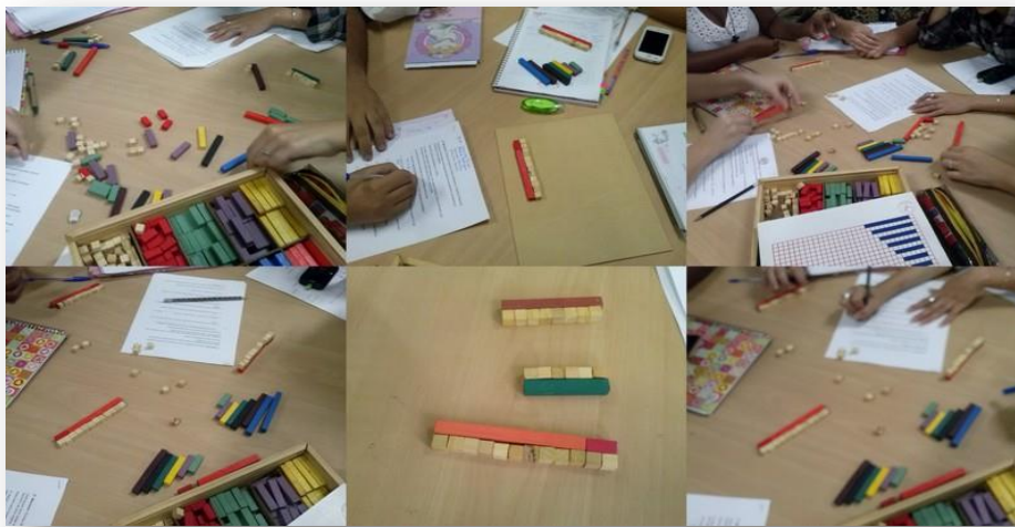
Figura 2. Alunos de Pedagogia utilizam as régulas de Cuisenaire na divisão do inteiro em frações.

O teste foi aplicado em um único encontro realizado em dois turnos, nas turmas do curso vespertino e noturno. Em um primeiro momento, a professora da disciplina realizou uma aula expositiva sobre formas significativas de abordar o conceito de número fracionário, onde um deles era o significado parte-todo. Em seguida, foi apresentada a proposta da atividade com as régulas de Cuisenaire e a turma foi dividida em grupos, para facilitar o manuseio do material e a observação das formas de raciocínio e negociações utilizadas pelos estudantes para a compreensão e a realização da tarefa.