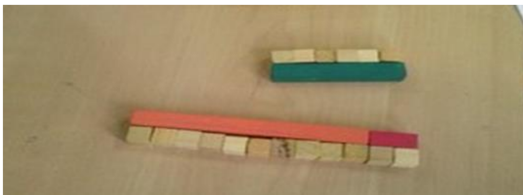
Foto 3: primeiro inteiro (régua vermelha e laranja) e segundo inteiro (régua verde).

A foto abaixo se refere aos dois inteiros utilizados na atividade: