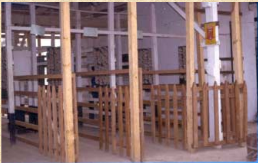
PCC 2302 AULA 11