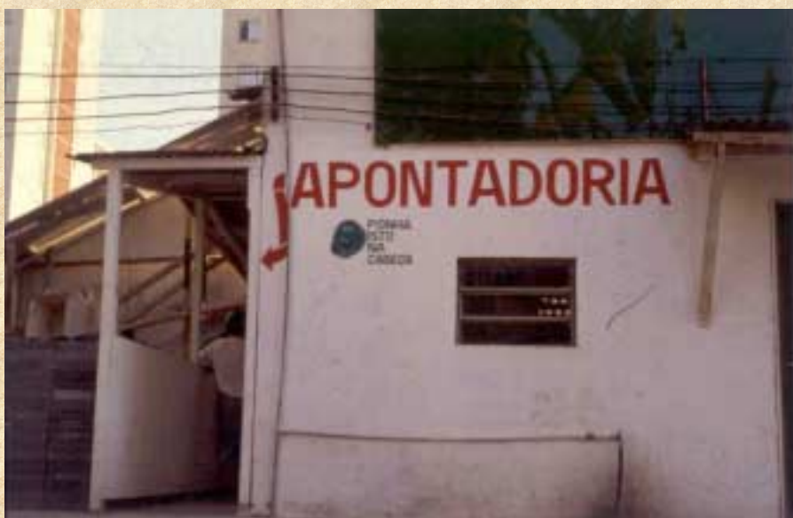
PCC 2302 AULA 11